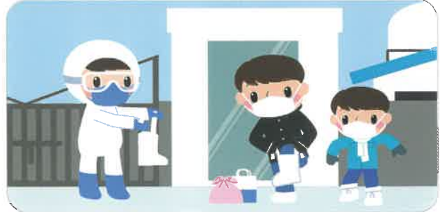
불가피한 경우 대인소독 및 방역복 착용, 사육시설 진입 금지