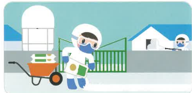
“농장 4단계 소독” 매일 실천