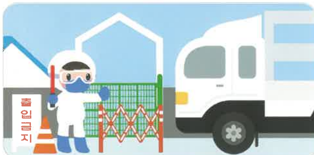
외부 사람·차량 출입을 엄격히 통제