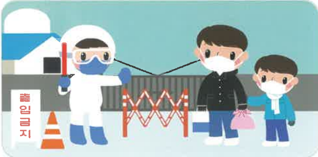
축산농장 방문 자제(오염원 유입 위험)