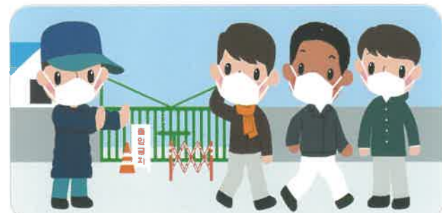
축산 관계자 간 모임 자제