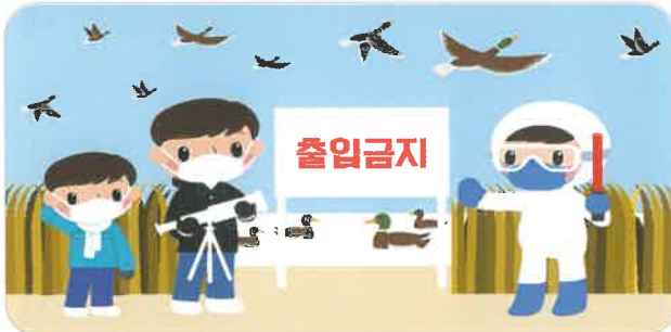
낚시·산책 등 철새도래지 출입 금지