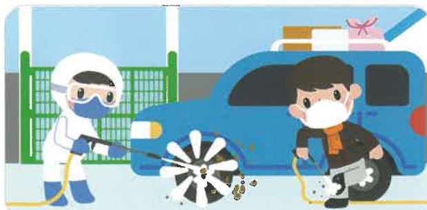
성묘 직후 사육시설 출입 금지, 차량·의복·신발 소독